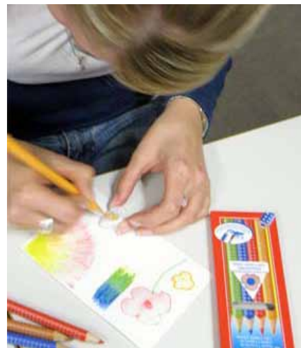
„Zeichnen und Malen - die Basis für kognitives Lernen“ (Faber-Castell / Mediastep-Institut, Stephanie Müller)

Zeichnen und Malen sind wesentliche Grundlagen für den Lern- und Entwicklungsprozess und haben enorme Wirkungsfähigkeit in Bezug auf den Lernzuwachs. Im Seminar werden die Aufgaben und das Potenzial des Bildungsbereiches „Ästhetische Erziehung“ erläutert.