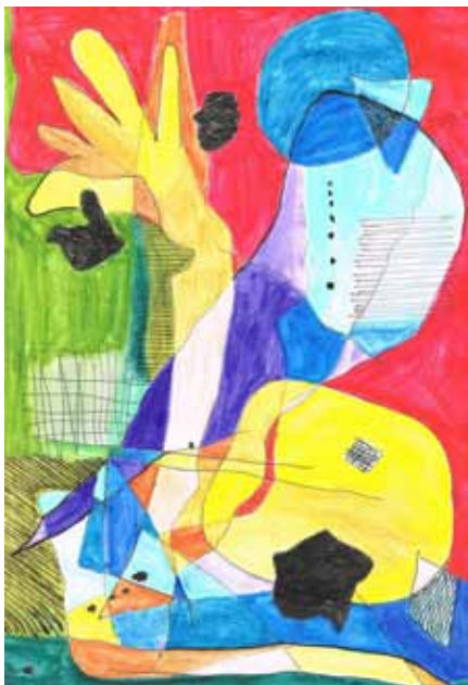
„Linie, Spur, Fläche und Form“ Der Farbstift als Ausdrucksmittel (Akademie Faber-Castell, Christine März)

Dieser Thementag dient der Vorstellung von Malwerkzeug, Malbegriffen und Mallust. Angesprochen sind Menschen, welche in Ihrer täglichen Arbeit mit Kindergarten- bzw. Vorschulkindern und Grundschulern das Medium Bild gestalterisch und spielerisch einsetzen und auch Erwachsene, die „nicht malen“ können, aber gerne Ihre Buntheit ausdrücken wollen.