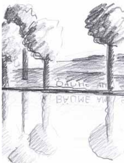
„Tanz der Linien – Bäume am See“ Informationsveranstaltung Kinder- und Jugendkunstschule (Akademie Faber-Castell, Pauline Ullrich)

Methodik / Didaktikschwerpunkt: Malen und Zeichnen als Mittel zur Resilienzförderung